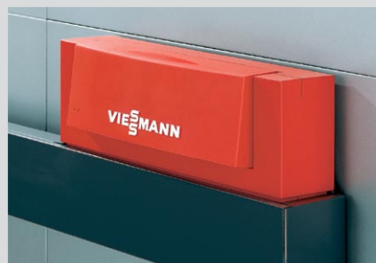
Vitoplex 300 80 do 460 kW