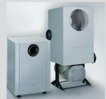
Vitotrans 300 – ekonomizer kondensacyjny