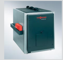
Vitoplex 300 575 do 1950 kW